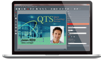
Logiciel de personnalisation de cartes Evolis Badge Studio®+ (incluant l'importation depuis les bases de données)