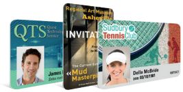
Cartothèque en ligne